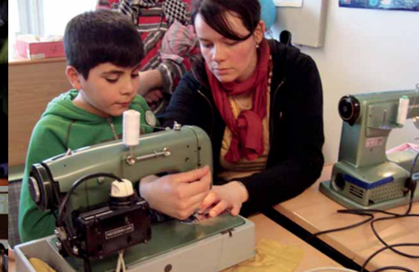
Links und oben: Projekttag an der Fridtjof Nansen Schule, Hannover

Sie können die Module einzeln oder als Paket buchen. Ob für eine Projektwoche oder den Ganztagsunterricht, wir entwerfen mit Ihnen ein Angebot, das zu Ihrer Schule passt. Setzen Sie sich mit uns in Verbindung!